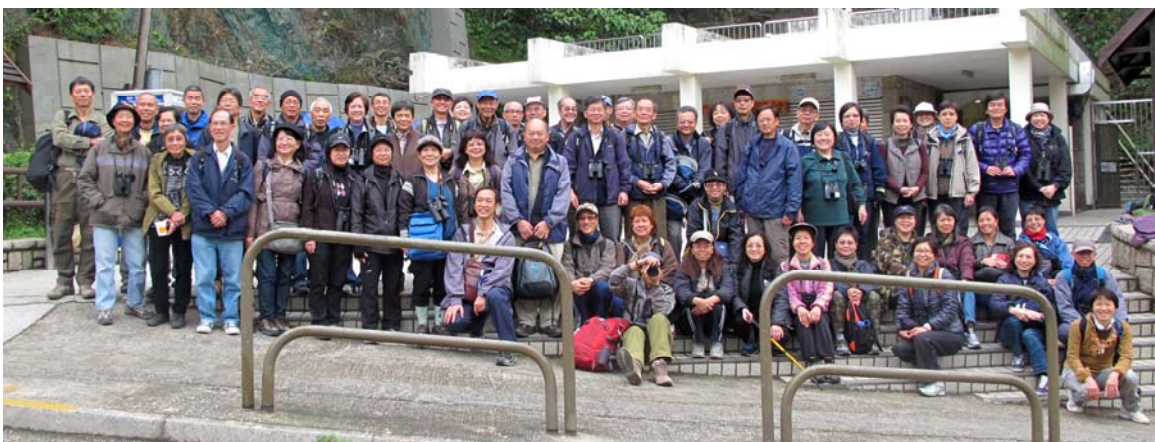
城門 水塘 林鳥 觀察 實習

回顧 2011 年 10 月 7 日的紅耳鸛俱樂部委員會例行會議中，通過決定培訓班在 2012 年 2 月舉辦。義工培訓班在香港觀鳥會的支持下，以自助形式進行。舉辦的目的除了為紅耳鸛增添活力和生產力外，藉此推廣「以觀鳥為先，保護自然生境在後，讓大自然的生物有一個家」的信念。