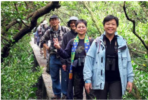
編者按：由右至左第四位為本文作者

在一個機緣下，得到紅耳鸕俱樂部會員介紹下前來參加觀鳥義工培訓班，在各位導師指導下，我懂得如何量度雀鳥的長度，包括體長和翼長。能夠分辨出海洋性濕地，淡水濕地和遮蔽性濕地等。更重要的是在不騷擾雀鳥下，尊重他人，以鳥為先，如何觀賞雀鳥。同時很開心地說出經過這課程，我終於能夠把雙筒望遠鏡的兩個圈鏡頭調較成為清晰的一個圈了。