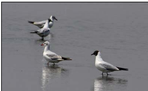
(哼！叫親你去街都面黑黑)