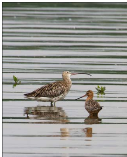
( 我睬你都傻! )