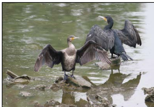
( 咁好陽光，晒晒件披先! )