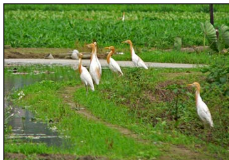
( 快的啦，成日都咁漏氣! )