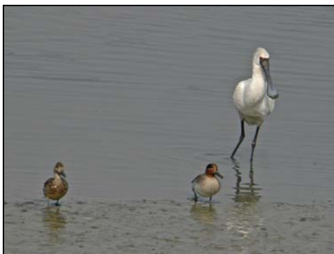
( 信我啦，你地唔襯架! )