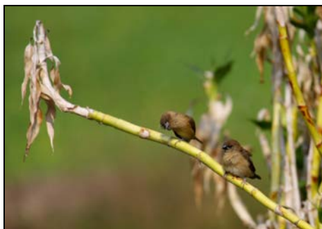
( 都叫妳換咗隻洗頭水咯! )