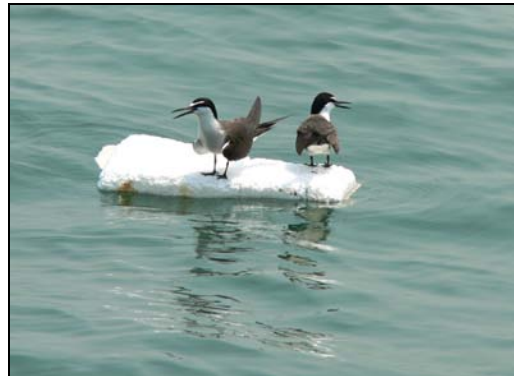
(嘩！真係夠鐘就開船)