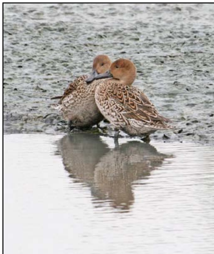
( 妳唔好講俾第二個知 )