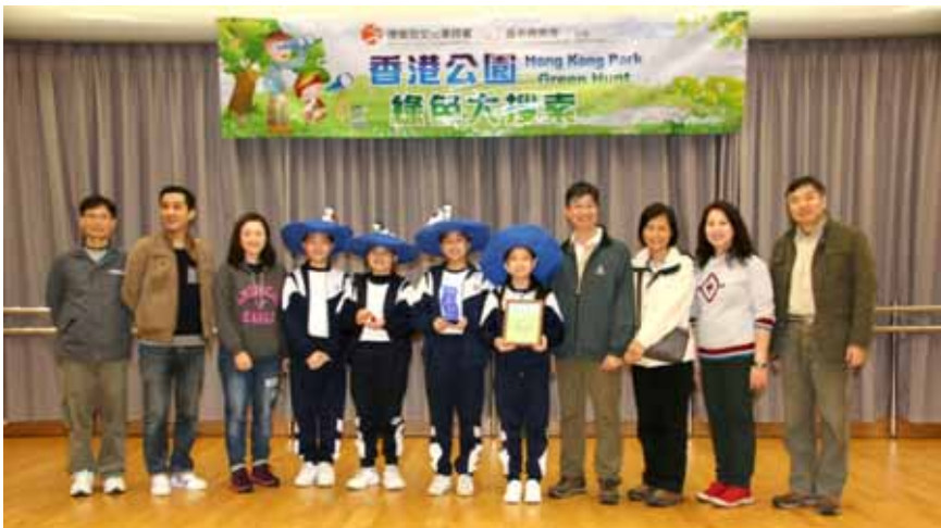
亞軍—九龍婦女福利會李炳紀念學校反嘴鵲隊

「同學們，發現鳥蹤時，切勿高聲大叫，否則會嚇走鳥兒」； 「對，可以提起望遠鏡去觀賞牠們的羽毛顏色、形態和動作」； 「也可以用紙和筆記下鳥兒的名稱、數目和特徵」； 「切記不可以邊行邊觀鳥，也不可以用望遠鏡看太陽，很危險呢」！