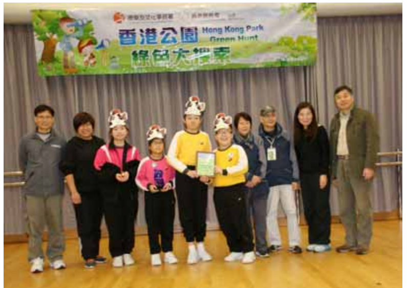
季軍—香港普通話研習社科技創意小學麻雀隊

「鳥兒可愛嗎？你們喜愛牠們嗎？那麼便要愛惜和保護牠們。回到家，也要和父母分享愛護大自然的訊息……」