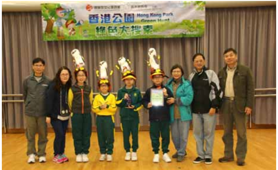
比賽冠軍隊伍—鳳溪廖潤琛紀念學校黑翅鳶隊

孩子們剛進入公園內已驚動了園內居住的雀鳥，大家都瞪大眼睛，異口同聲地談論著這一刻熱鬧的情境。我們害怕人類的活動會滋擾寧靜的生活。香港公園雖然位於市區內，但因為廣種樹木，再加上園內的溪流、水池、懸崖和瀑布，正好成為一個適合雀鳥棲息的理想家園。平日遊人不多，遊人和雀鳥都是互相悠閒地觀賞、各自活動，今天會有甚麼活動呢？