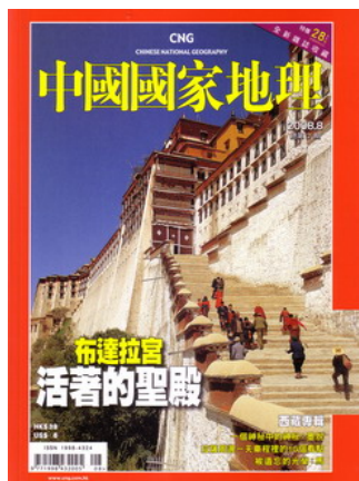
2008 年 8 月第二期