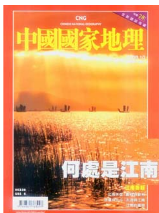
2008 年 10 月第四期