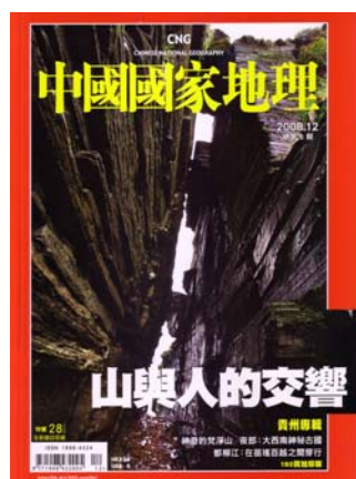
2008 年 12 月第六期