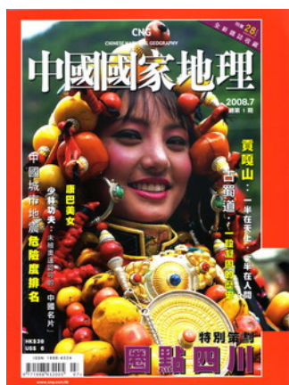
2008 年 7 月創刊號

踏入新的一年，我們特別向《香港觀鳥會》的會員特別提供震撼優惠，以低於六折價錢便可享有《中國國家地理》的一年訂閱優惠。