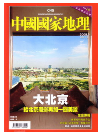
2008 年 9 月第三期