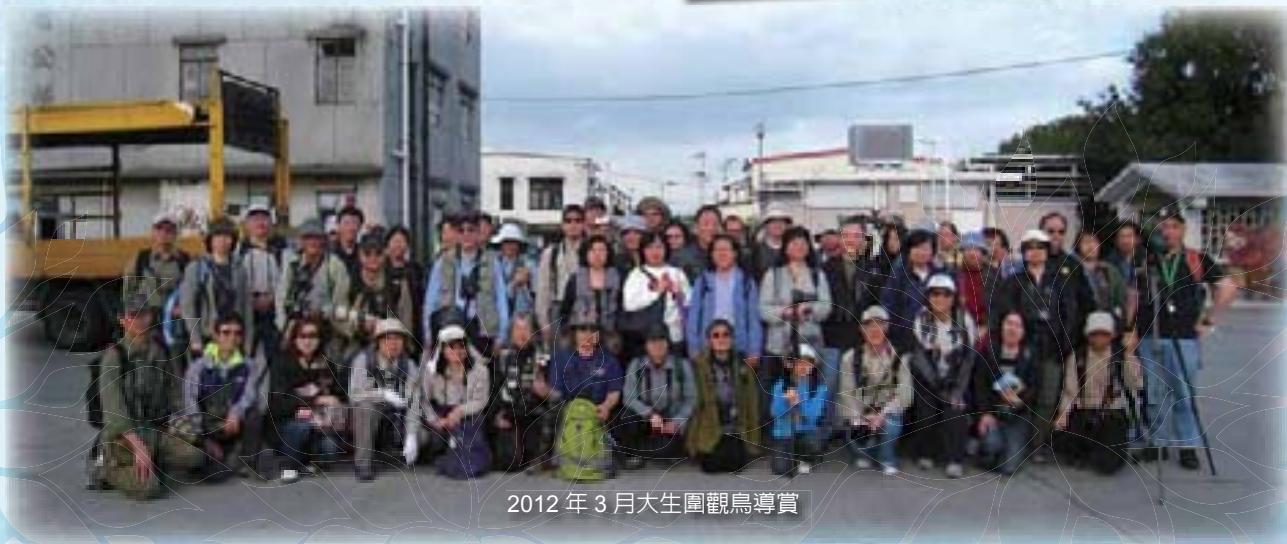
2012年3月大生圍觀鳥導賞