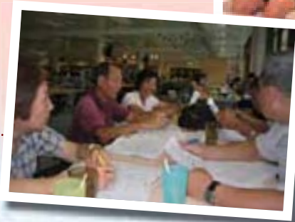
紅磡理工大學 學生飯堂開會