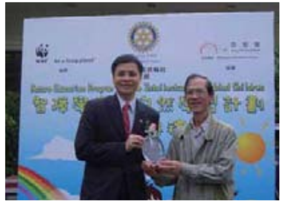
協助米埔舉辦智障學童大自然學習計劃

首次與香港海防博物館合作，於該館周圍之園林及海旁一帶舉辦觀鳥及生態導賞，對象為該館的家庭組別。此後每年定期舉行。