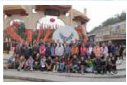
2010年12月19日 深圳東湖公園觀鳥