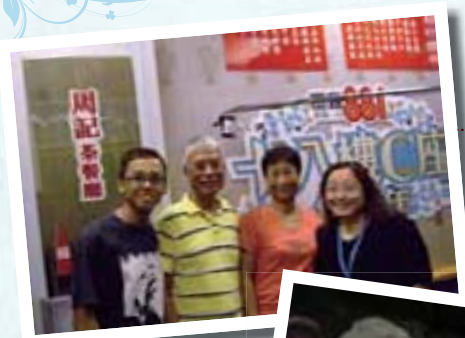
2008 接受商業 電台訪問