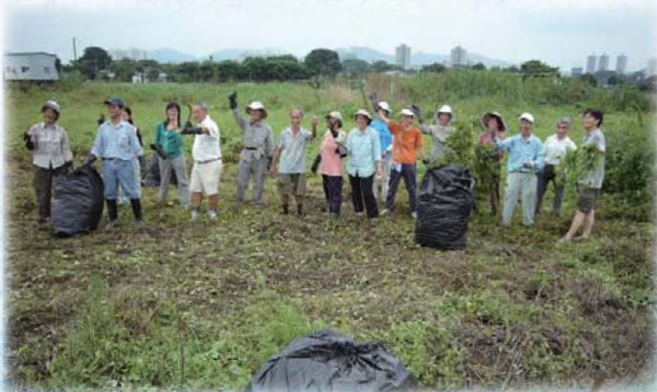
2006年6月11日壟原清除薇甘菊