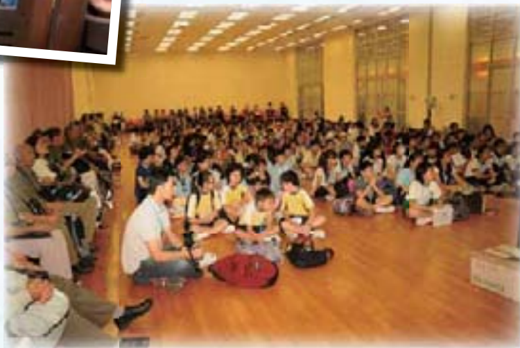
2009年香港公園綠色大搜索