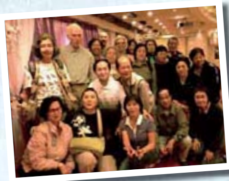
2010年11月 九龍公園導賞 義工與觀鳥遊 客茶聚後留念

2006年6月開始，俱樂部定於每月第一個星期六到不同的郊野觀鳥熱點進行觀鳥活動，由每組成員輪流當值擔任導賞。參加者無須報名，但需自行安排交通，歡迎任何人士參加分享郊野觀鳥樂趣。