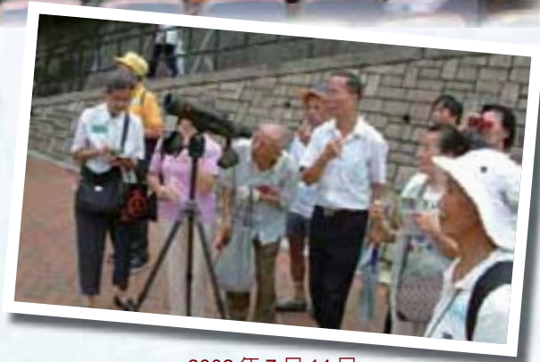
2002年7月14日 第一屆培訓班實習