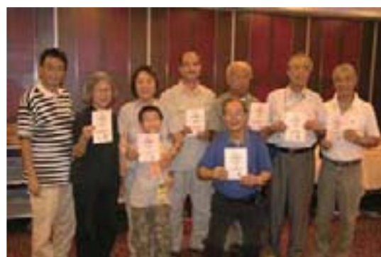
2005 年 8 月 25 日成立兩周年聚餐

多謝所有紅耳鶉俱樂部老友記們在這 10 年中以觀鳥為平台，不停的自我增值，對社會作出無私及多元化的服務。通過組員之間和對社會的互相關懷和貢獻，您們使這世界更美麗。