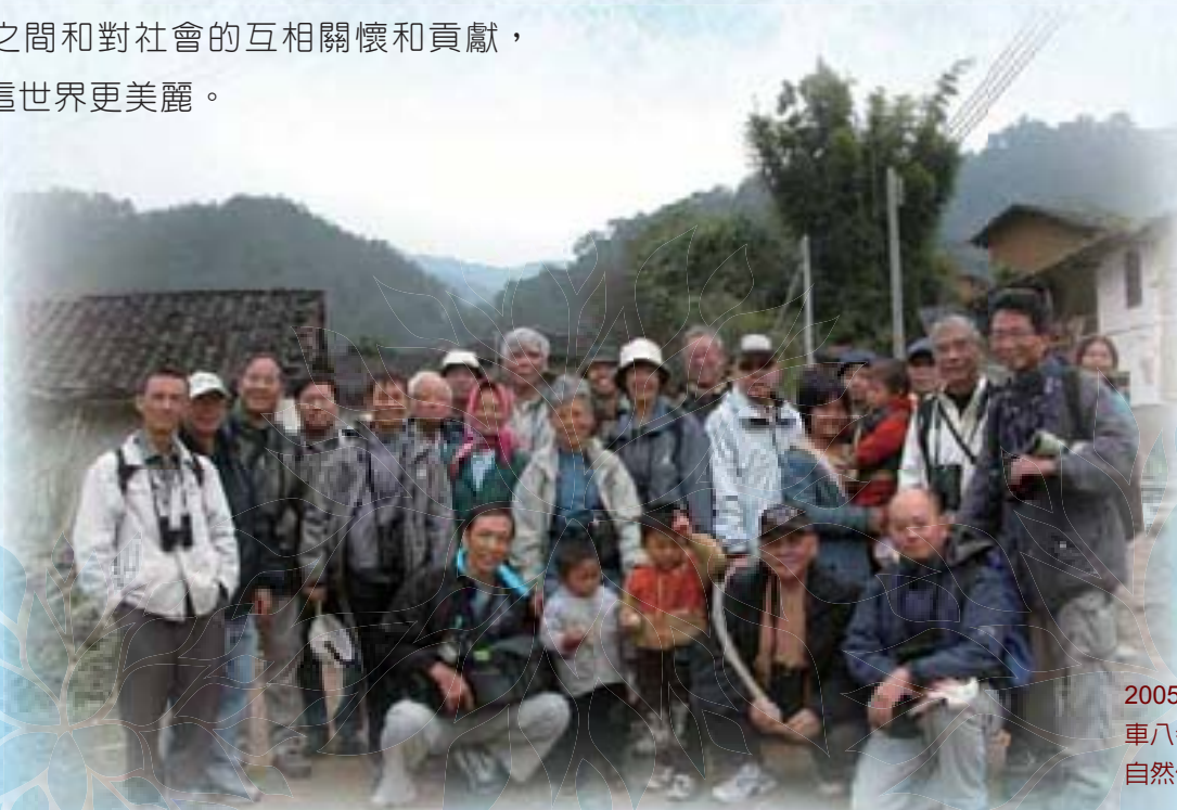
2005 年 10 月 28 日 車八嶺國家級 自然保護區觀鳥