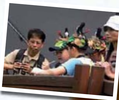
香港公園綠色大搜索

香港觀鳥會與香港公園合辦「香港公園綠色大搜索」，紅耳鶉俱樂部派出幾十名組員擔任每組評判，協助小學生進行大搜索活動，尋找公園內的動植物及雀鳥比賽，是一項既刺激、有趣及富教育性的活動。是項活動更一直無間斷地每年舉行，紅耳鶉組員成為義工的台柱。