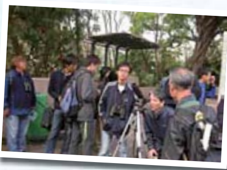
2004年3月九龍公園清晨觀鳥

九龍公園清晨觀鳥匯敘——2004年3月5日開始，逢星期五上午7時30分至9時30分，帶領公眾在公園觀鳥，無須報名，義工團以小組輪流當值為參加者免費提供觀鳥導賞服務。香港公園清晨觀鳥匯敘——2004年7月開始，逢星期三上午8時至10時進行。