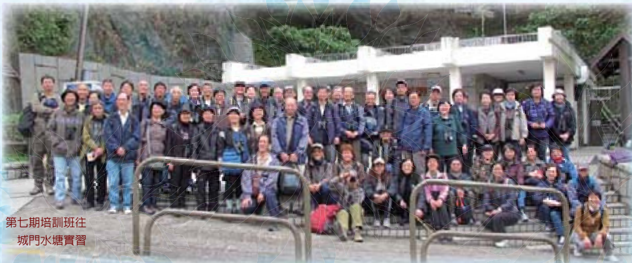
第七期培訓班往 城門水塘實習