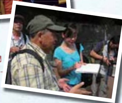
2004 年 6 月 接受報章記者訪問