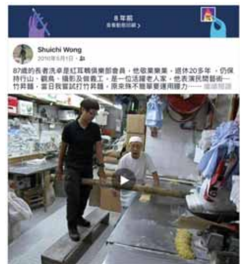
當年今日鳥友情在