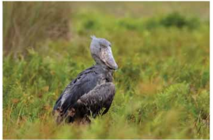
鯨頭鶴-喙部可穿透鱈魚皮革