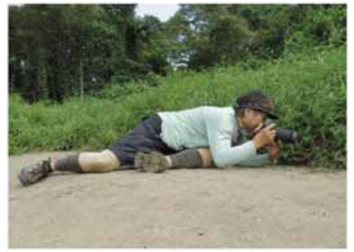
伏在地上身軀作腳架

萬物在心中，友情鳥所繫，歡樂由此起！接受完訪問，MON 姐又要趕著執拾行裝，這回去非洲看雀鳥大遷徙。