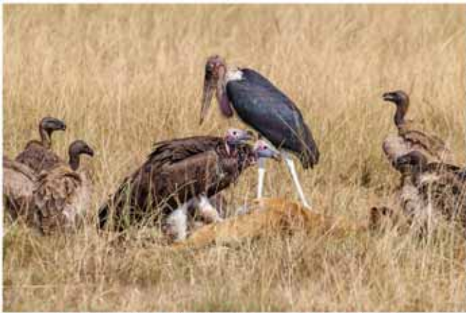
(前)皺臉禿鷲(後)禿鶴(旁)白背兀鷲