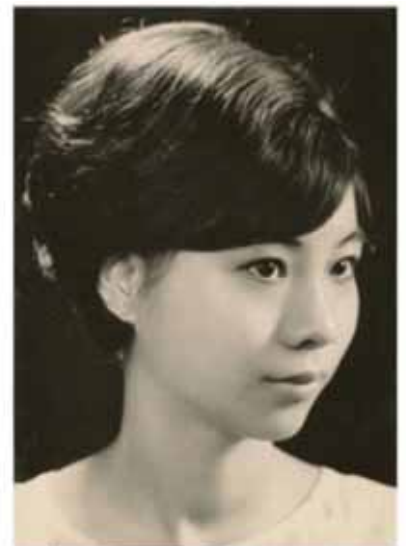
中學時的照片給影樓放在門外作生招牌