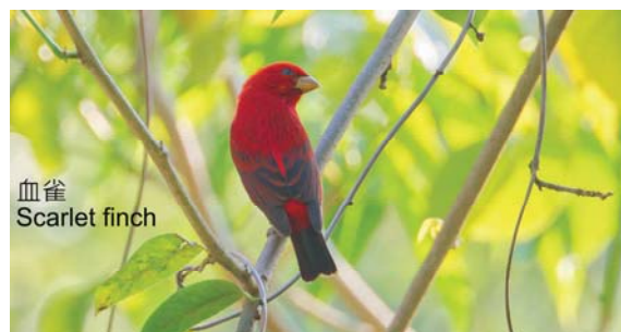
血雀 Scarlet finch

今次最難忘的是在百花嶺晨早六時半攀山去找血雀(由於血雀已不在鳥塘,跑上山去了),行了約大半個小時,等了約一個半小時才見到。觀血雀其間,更看到小燕尾、斑背燕尾和林鵬,更有難得一見的翠金鵒,可惜我未能拍得清楚。