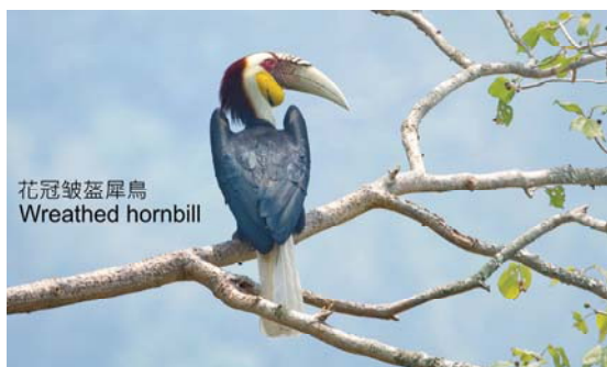
花冠皺盔犀鳥 Wreathed hornbill

就算傳統的鳥導知道那裏有特別鳥,也因為塘主已把鳥出沒的地方圈進自家範圍而不能進去,被迫付錢。觀鳥者也順理成章被引導走到鳥塘觀鳥,這個情況做就了很大的包括食、住、行各方面的觀鳥產業鏈。有些塘主亦頗獅子大開口,只有單一雀鳥也索價不菲。我們今次花在鳥塘費用是每人人民幣1,010元!