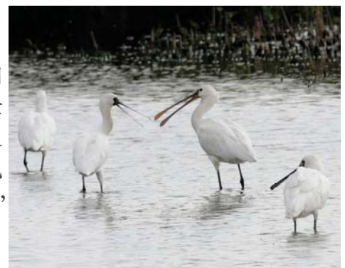
黑臉琵鷺

在米埔另一個觀鳥高潮位，當然是后海灣廣闊的潮間帶泥灘地！那是在要取得俗稱「浮橋證」的邊境許可證才能進入的範圍，師兄叫我們加快腳步，因為要趕及在退潮前去到觀鳥屋。觀鳥屋就隱身在紅樹林間、那道搖搖晃晃長長的浮橋盡頭處。入到觀鳥屋內，我們要輕聲細語，因雀鳥也有耳朵，不要驚動海灘上正在覓食的眾多候鳥與留鳥。