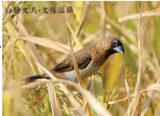
白腰文鳥

深秋的上水墾原濕地，稻米豐收、金黃遍地。洋溢的生機氣息，不單滋潤著香港繁囂市民的身心靈，同時更吸引著滿天白腰文鳥雀躍地共舞。