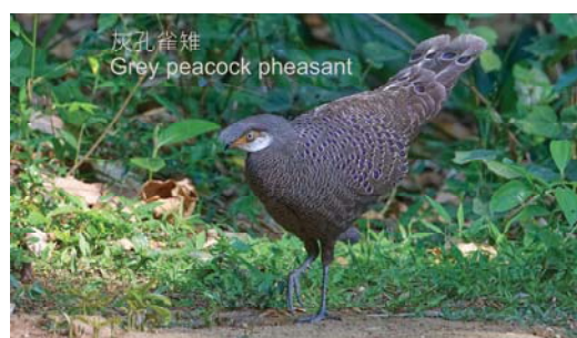
灰孔雀雉 Grey peacock pheasant