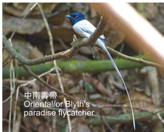
中南壽帶 Oriental/or Blyth's paradise flycatcher

值得一提是在石梯見到夢寐以求的 Frogmouth (黑頂蟆口鴟)正在坐巢和在那邦見到的 Hooded Pitta (綠胸八色鸚),亦在犀鳥谷見到 Great Hornbill (雙角犀鳥)和 Wreathed Hornbill (花冠皺盔犀鳥)。還有,我們在那邦田黃昏野拍時,見到和拍到中國第一次記錄到的白翅棲鴨(經我們的鳥導小杜向國內專家組求證後確認)。諷刺的是,只得四個香港人加上當地鳥導見到,飛走後再無人見到,後來趕到的內地人都無緣一睹。