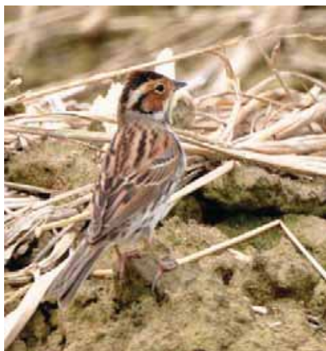
紅頸 瓣蹼 鶺鴒