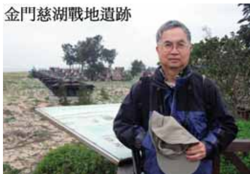
金門慈湖戰地遺跡

3/25 開始我們最後 2 天的傳統的廈門觀光旅遊，回到廈門這個繁囂都市，車水馬龍，沒有清新的空氣和寧靜的環境，我患濕疹的皮膚開始抗議，感到痕癢。曾參觀過的景點如鼓浪嶼，南普陀寺，胡里山炮台等，都人頭湧湧，與剛剛離開一個類似世外桃源的金門作比較，我對以上的景點竟然毫無感覺，但我還是很欣賞廈門那無窮無盡的 15 公里長的沙灘。至於食物方面，乏善足陳，可能是團體包餐的原故吧。